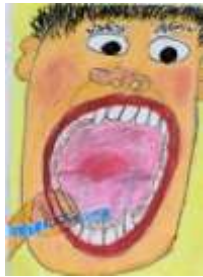
菰田小1年 みつぎ しょうた