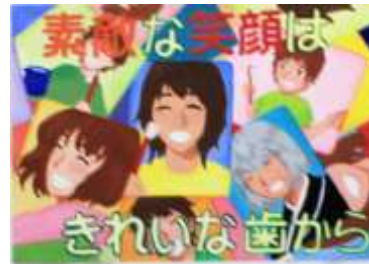
飯塚第一中 3年 中園 晴香