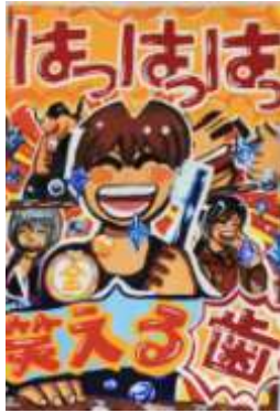
飯塚第一中 3年 梶原 千春