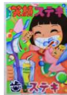
飯塚第一中 3年 横城 侑葵