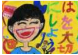
穂波東小3年 のみやま かほ