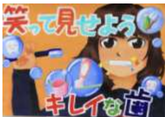
飯塚第一中 2年 高橋 楓