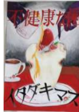
鎮西中 3年 橋爪 愛香瑠