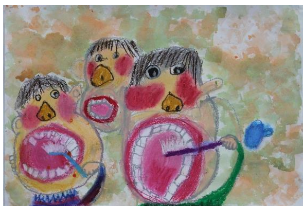
桂川東小 1年 すみさか りあ