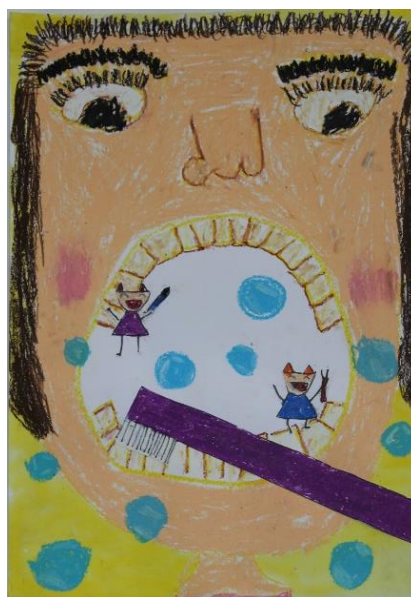
片島小 1年 ほりい まなみ