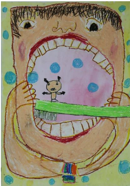
片島小 1年 おおつか のぞみ