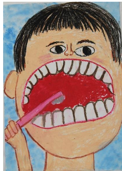
飯塚小 1年 きたがわ みゆう