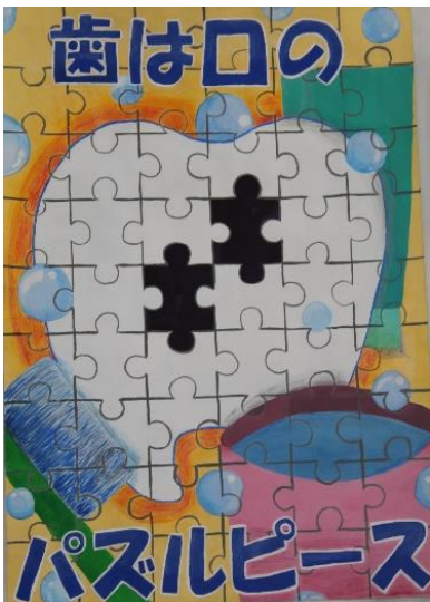
飯塚第一中 3年 厚喜 陽菜