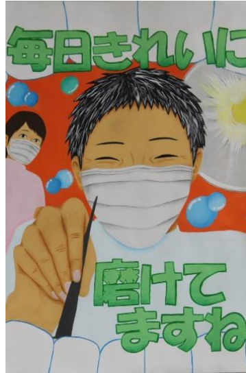
飯塚第一中 3年 師岡 亜未